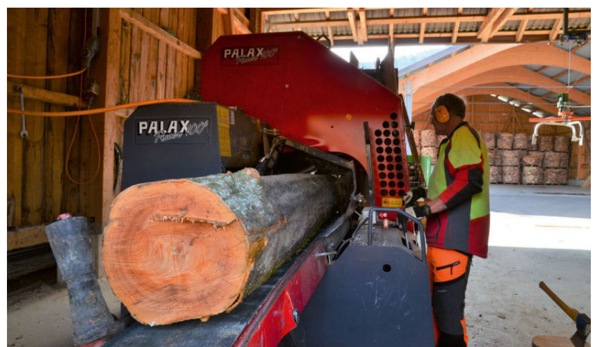
Abb. 1: Effiziente Energie-Stückholzproduktion in der Brennholzzentrale des Forstbetriebes Obertoggenburg